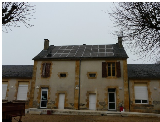
les panneaux photovoltaïques sur le toit de l'école

aux enfants et au public de visualiser le fonctionnement de l'installation en suivant la production et la consommation.