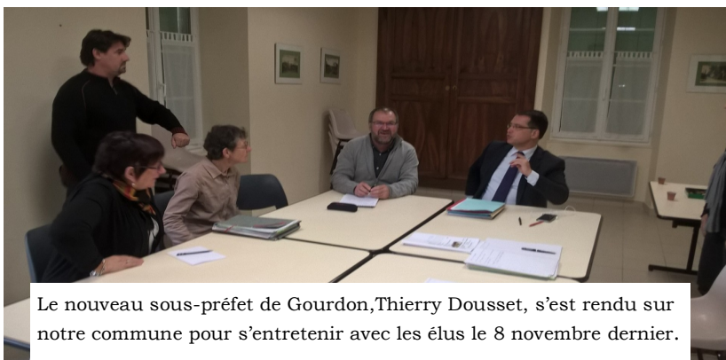
Le nouveau sous-préfet de Gourdon, Thierry Dousset, s'est rendu sur notre commune pour s'entretenir avec les élus le 8 novembre dernier.